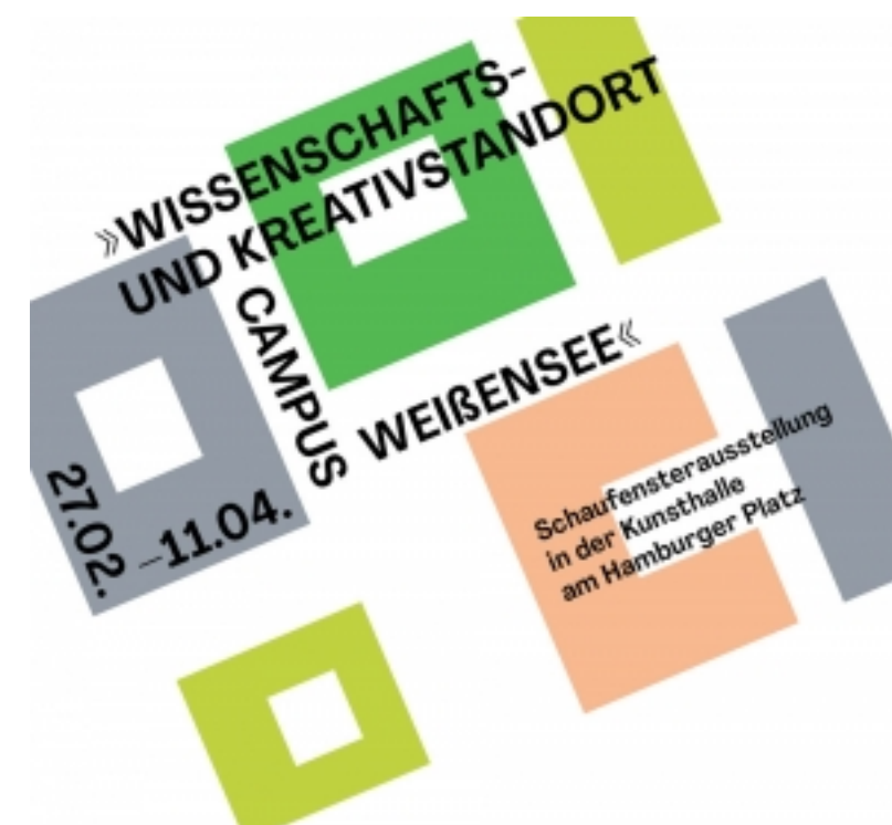
Kunsthalle am Hamburger Platz