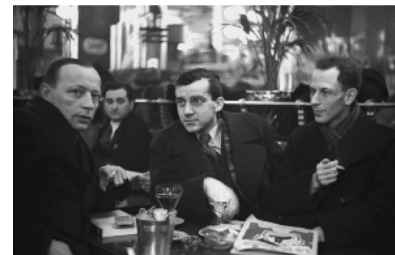
Deutsches Historisches Museum (DHM)