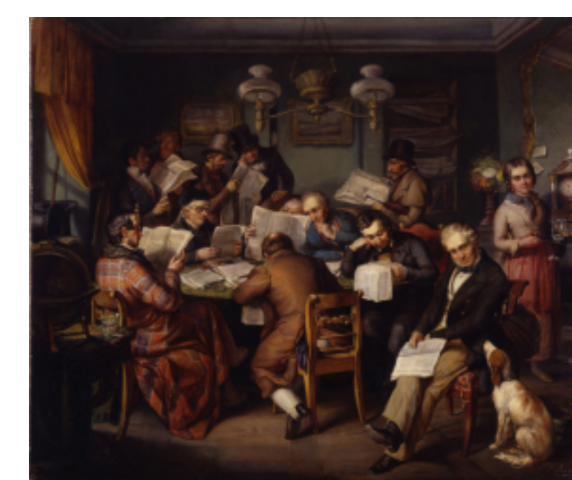
Deutsches Historisches Museum (DHM)