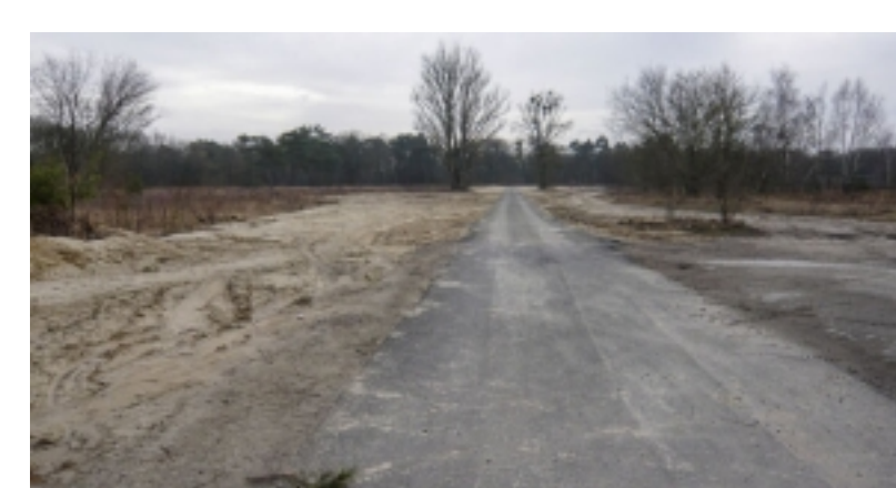
Kommunale Galerie Berlin