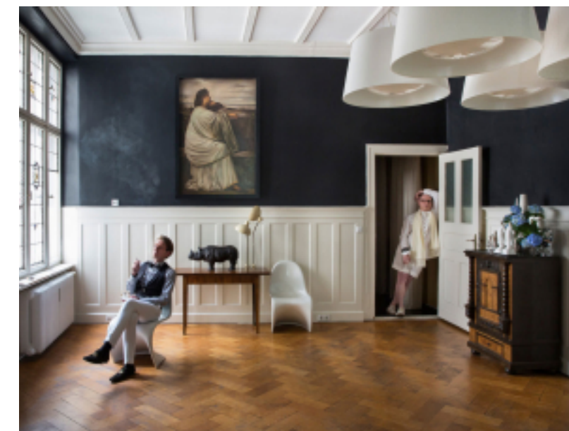
Haus am Kleistpark